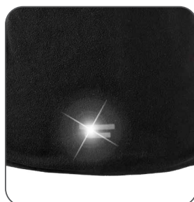
reflexní doplňky reflexné doplnky reflective accessories elementy odblaskowe